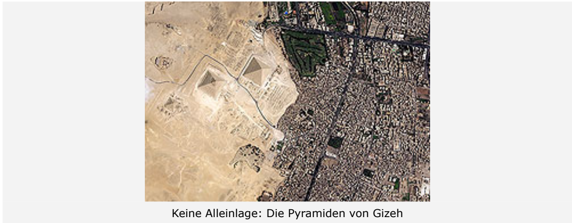
Keine Alleinlage: Die Pyramiden von Gizeh

Neben dem wissenschaftlichen Wert der vom Deutschen Fernerkundungsdatenzentrum (DFD) des DLR bereitgestellten Bilder verfügen die Aufnahmen auch über einen besonderen ästhetischen Reiz. Die hochauflösenden Satellitenaufnahmen zeigen vermeintlich bekannte Gebiete in neuem Licht oder bieten Einblicke in fast unbekannte Gebiete unseres Planeten.