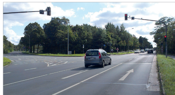
Halle (Saale), Dölauer Straße/ Brandbergweg