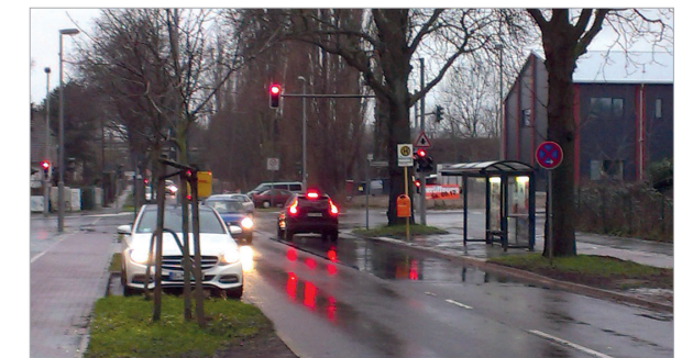
Berlin, Weißenhöher Straße/ Grabensprung