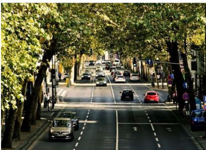
Synthetische Kraftstoffe haben neben der Klimaneutralität ein hohes Potenzial zur Verbesserung der lokalen Luftqualität

Mit der Entwicklung, Bewertung und Begleitung von Prozessen und Technologien zur marktreifen Produktion von synthetischen Kraftstoffen leistet das DLR einen wesentlichen Beitrag zur Verkehrswende und zum Erreichen der Klimaschutzziele im Verkehrssektor. Zudem wird Deutschlands Rolle als wichtiger Exporteur von Technologie und Industrieanlagen gesichert.