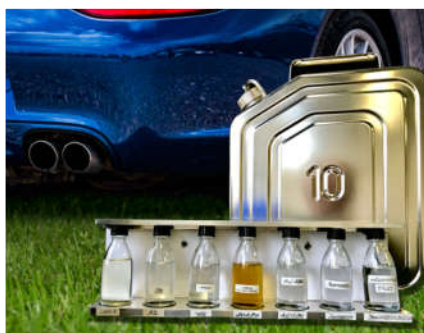
Renaissance des Verbrennungsmotors durch klimaneutrale synthetische Kraftstoffe?

Deutschlands Klimaschutzziele sehen bis 2030 eine Reduzierung der Treibhausgasemissionen um mindestens 55 % gegenüber 1990 vor. Bis 2050 soll eine weitgehende Treibhausgasneutralität erreicht sein. Der Verkehrssektor soll dazu bis 2030 mit einer Reduzierung von 40-42 % beitragen. Im Verkehr ist der Treibhausgasausstoß gegenüber 1990 bisher jedoch nicht gesunken, sondern lag 2017 sogar knapp über dem Ausgangswert. Um die Klimaschutzziele zu erreichen, müssen die Anstrengungen zur CO 2 -Reduktion im Verkehrssektor erheblich ausgeweitet werden. Klimaneutrale Kraftstoffe haben das Potential, einen wesentlichen Beitrag zu leisten, wenn ihre Erforschung, Entwicklung und Markteinführung verstärkt gefördert werden.