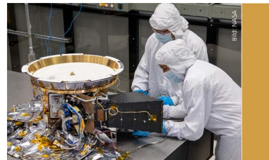
Im Labor des Goddard Space Center der NASA in Greenbelt, Maryland, wird an L'Orpheus gearbeitet, dem kompliziertesten Instrument der Lucy-Mission. Es besteht aus einer Kamera, die Farbbilder aufnehmen wird, und einem Infrarotspektrometer.

Bald folgten weitere Entdeckungen. Heute sind im Asteroiden-Hauptgürtel mehr als eine Million von kleinen Körpern bekannt. Sie werden als Überbleibsel der Planetenentstehung interpretiert: Trümmer aus Gestein, Metallen und – in den weiter von der Sonne entfernten Zonen – auch Eis, die sich durch die störende Gravitation Jupiters nicht zu einem Planeten zusammenfügen konnten. Die unzähligen Krater auf Mars, Mond oder Merkur zeigen uns, dass der Riesenplanet, der