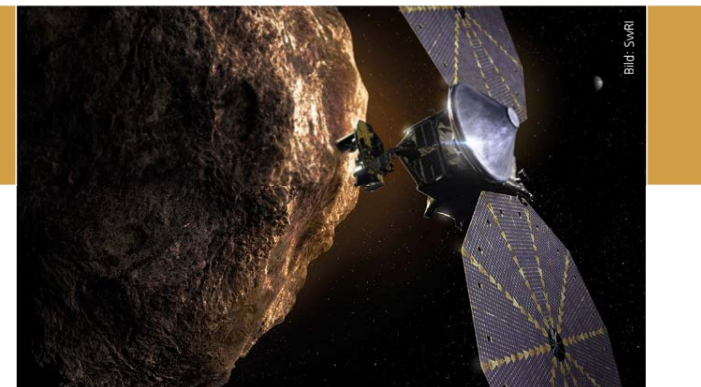
Künstlerische Darstellung der Raumsonde Lucy beim Vorbeiflug an einem der Trojaner-Asteroiden

Nun also wird Lucy ihre Reise zu den Jupiter-Trojanern antreten. Dafür gibt es einen triftigen wissenschaftlichen Grund: Es wird vermutet, dass diese Trojaner im Gegensatz zu den Hauptgürtel-Asteroiden weniger mit den Körpern des inneren Sonnensystems gemein haben, sondern mehr mit den äußeren Regionen unseres Planetensystems. Mit Jupiter, in fast fünffacher Erdentfernung zur Sonne, beginnt das