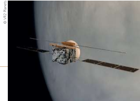
EnVision ist Kandidat für einen ESA-Venusorbiter, der mit Radar auf und unter die Oberfläche „blicken“ und darüber hinaus aktive Vulkane entdecken soll

Dazu ein kurzer Blick auf die formalen Bedingungen: Venus und Erde – fast gleich groß, mit fast gleicher Masse, fast identischem „Inventar“ an chemischen Elementen und in ähnlicher mineralogischer Zusammensetzung. Auch wenn die Venus der Sonne „nur“ 50 Millionen Kilometer näher ist, könnte das schon ein Teil der Erklärung für die Unterschiede zwischen den ungleichen Geschwistern sein. Für die Planetenbildung gilt sehr grob verallgemeinert: je größer die Entfernung von der Sonne, desto niedriger der Anteil an schweren Elementen, wie Eisen, Nickel, Magnesium oder Silizium, und desto höher der Anteil an flüchtigen Stoffen, wie Wasserstoff oder Kohlenstoff. Schwere, erdähnliche Planeten mit fester Oberfläche haben sich deshalb im inneren Sonnensystem gebildet, die Gasplaneten in Entfernungen ab etwa einer Milliarde Kilometer. Ist der geringfügige Unterschied zwischen den Umlaufbahnen von Venus und Erde, von etwa 100 zu 150 Millionen Kilometern, der entscheidende Unterschied und verantwortlich dafür, dass die Venus kaum oder kein Wasser aus der zirkumsolaren Scheibe aus Staub und Gas abbekommen hat? Mag sein, dass dies eine der Ursachen für die Wasserarmut der Venus ist. Aber das Wasser der Erde stammt sehr wahrscheinlich nicht nur