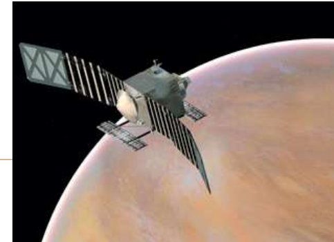
VERITAS ist in der Endauswahl für eine von zwei neuen Missionen des NASA-Discovery-Programms. Der Orbiter soll die Venusoberfläche kartieren.