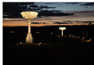
Flyer Summer Camp 2011

A joint initiative of UAHuntsville, German Aerospace Agency (DLR) and the University of Rostock, supported by the University of Greifswald