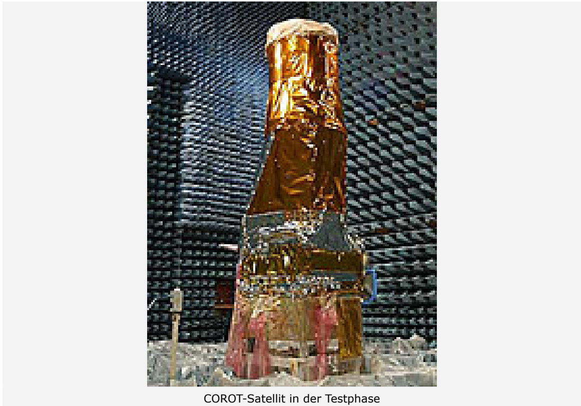
COROT-Satellit in der Testphase

Frage: Gibt es im All Regionen, wo Sie mehr Planeten vermuten als in anderen?