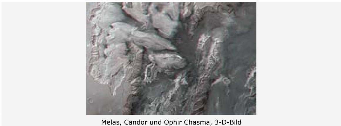
Melas, Candor und Ophir Chasma, 3-D-Bild

Die vom Deutschen Zentrum für Luft- und Raumfahrt (DLR) betriebene, hochauflösende Stereokamera HRSC an Bord der ESA-Raumsonde Mars Express machte während der Orbits 334 und 360 Aufnahmen des zentralen Teils des 4000 Kilometer langen Canyons Valles Marineris auf dem Mars. Die Bildauflösung beträgt zwischen 21 und 30 Meter pro Bildpunkt. Die Abbildungen entstammen einem Mosaik der während der beiden Orbits aufgenommenen Bildsequenzen und zeigen einen etwa 600 Kilometer hohen und 300 Kilometer breiten Ausschnitt zwischen drei und 13 Grad südlicher Breite bzw. 284 und 289 Grad östlicher Länge.