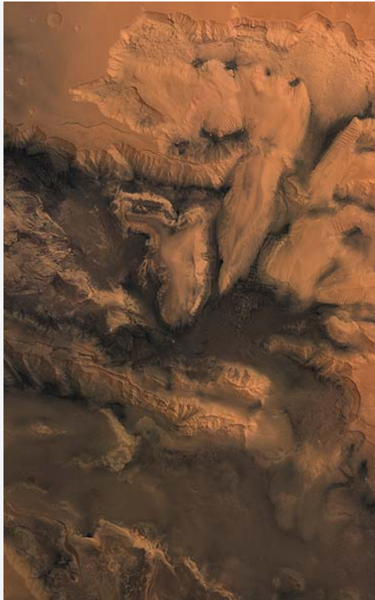
Melas, Candor und Ophir Chasma, Farbansicht

Wie diese riesige geologische Struktur entstanden ist, kann immer noch nicht mit Gewissheit gesagt werden. Möglicherweise führten Spannungen in der Marskruste zu einem Aufreißen des Hochlands und einem Absinken der Gesteinsschollen zwischen den Bruchlinien. Dieses Auseinanderbrechen könnte sich ereignet haben, als vor Milliarden von Jahren unter der sich nach Westen erstreckenden Tharsis-Region vulkanische Aktivität einsetzte und das Gebiet zu einem mehrere Kilometer hohen langgezogenen Bergrücken aufgewölbt wurde. Auf der Erde bezeichnet man solche die Kruste in ihrer ganzen Tiefe durchziehenden Grabenbrüche als "Rift".