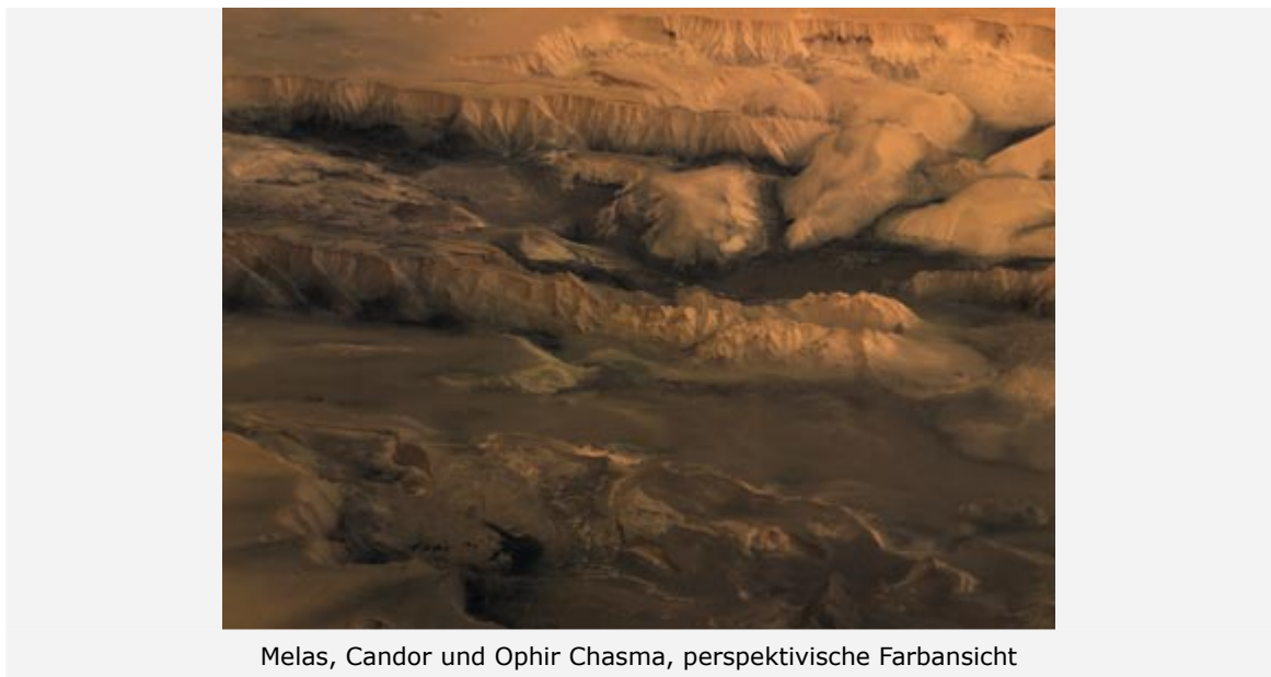
Melas, Candor und Ophir Chasma, perspektivische Farbansicht

Die vom Deutschen Zentrum für Luft- und Raumfahrt (DLR) betriebene, hochauflösende Stereokamera HRSC an Bord der ESA-Raumsonde Mars Express machte während der Orbits 334 und 360 Aufnahmen des zentralen Teils des 4000 Kilometer langen Canyons Valles Marineris auf dem Mars. Die Bildauflösung beträgt zwischen 21 und 30 Meter pro Bildpunkt. Die Abbildungen entstammen einem Mosaik der während der beiden Orbits aufgenommenen Bildsequenzen und zeigen einen etwa 600 Kilometer hohen und 300 Kilometer breiten Ausschnitt zwischen drei und 13 Grad südlicher Breite bzw. 284 und 289 Grad östlicher Länge.